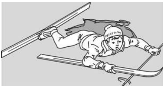
Попытки вылезти самому из полыньи с лыжами

Провалившемуся необходимо внушить, чтобы он широко раскинул руки на льду и ждал помощи, так как самостоятельная попытка вылезти из воды может привести к новому обламыванию кромки льда и очередному погружению пострадавшего под лед.