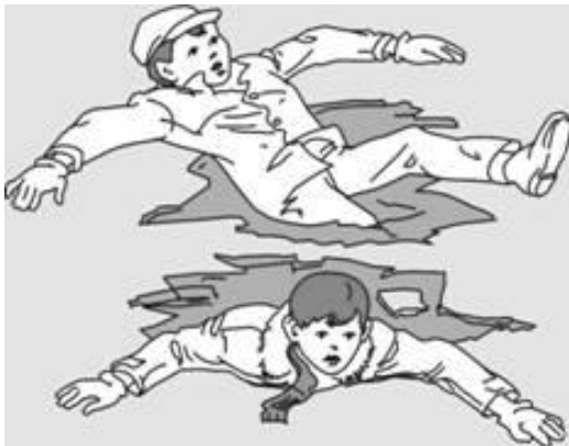
Попытки вылезти самому из полыньи грудью или спиной

Если вы провалились под лед, широко раскиньте руки, навалитесь грудью или спиной на лед и постарайтесь вылезти на него самостоятельно, зовите на помощь.