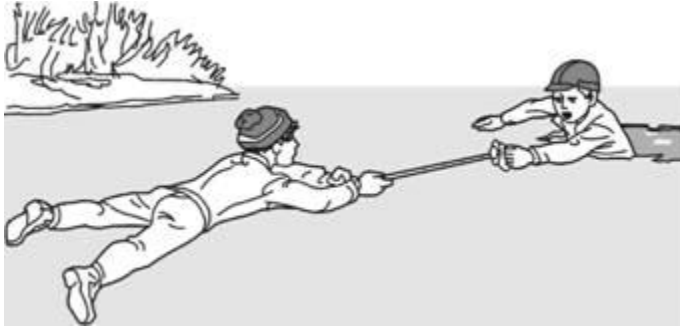
Помощь лыжной палкой

друга за ноги, а первый подает пострадавшему лыжные палки, шарф, одежду и т. д. Деревянные предметы (лестницы, жерди, доски и др.) необходимо толкать по льду осторожно, чтобы не ударить пострадавшего. Спасатель при этом должен обезопасить и себя. Продвигаясь к пострадавшему, следует ложиться на доску, лыжи и другие предметы.